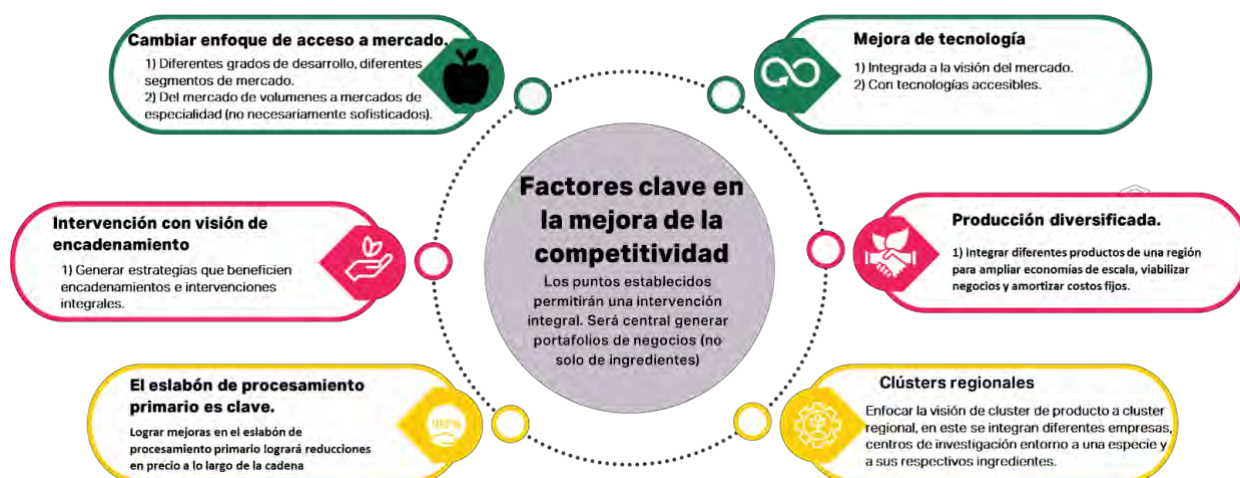
Diagrama 3. Resumen factores claves en la mejora de la competitividad-.

El diagrama adjunto condensa los hallazgos del estudio, destacando especialmente las mejoras tecnológicas viables y accesibles adaptadas a situaciones específicas, las cuales son las bases de las estrategias propuestas. Se recomienda una estrategia de procesamiento inicial o local que englobe tanto la producción como un procesamiento diversificado, abarcando distintos productos y enfoques de economía circular, todo ello organizado en clústeres regionales. Además, se aconseja segmentar la estrategia de acceso al mercado según la oferta, teniendo en cuenta los variados niveles de desarrollo y sofisticación de los productos presentados. Así, el acceso al mercado debería enfocarse en la propuesta de valor de cada empresa.