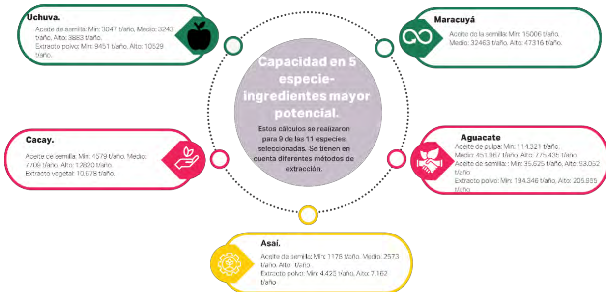
Diagrama 2. Capacidad país 5 especie-ingrediente.

En el desarrollo de la consultoría, se basaron las estimaciones de capacidad del país en la producción primaria de las especies base. Se analizó la oferta disponible de diversos ingredientes naturales intermedios y se evaluaron distintas tecnologías de extracción. Esto permitió determinar las capacidades máximas, medias y mínimas para cada uno de los ingredientes con mayor potencial de las cinco especies priorizadas, que incluyen el asaí, el maracuyá, el cacay, el aguacate y la uchuva.