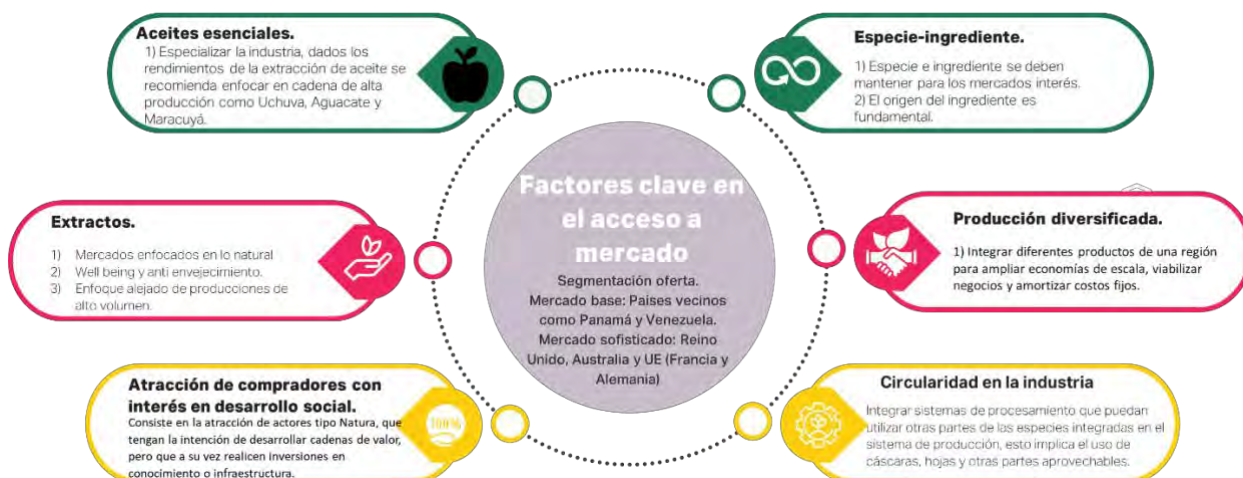
Diagrama 1. Resumen estrategias.

factores clave para diferenciar la producción nacional. Específicamente, se aconseja dirigir la extracción de aceites hacia productos con alta capacidad productiva como el maracuyá, la uchuva y el aguacate. Los segmentos de mercado más prometedores son aquellos centrados en el bienestar y el anti-envejecimiento, así como los que valoran lo natural y sostenible. Estratégicamente, es crucial atraer actores interesados en el desarrollo de cadenas productivas.